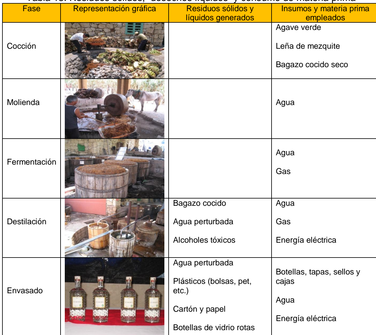
Tabla 13. Residuos sólidos, desechos líquidos y consumo de materia prima